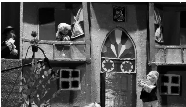
کارگردان: زهرا برجی