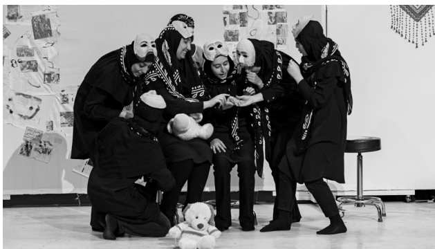
کارگردان: رحمت غلامی