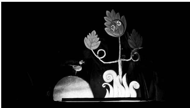
کارگردان: ملوک افشاری