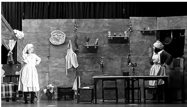
کارگردان: فرهاد ابوالفضلی