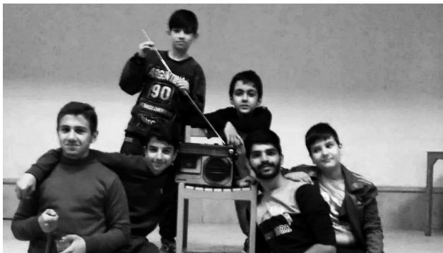
کارگردان: زهرا نوری