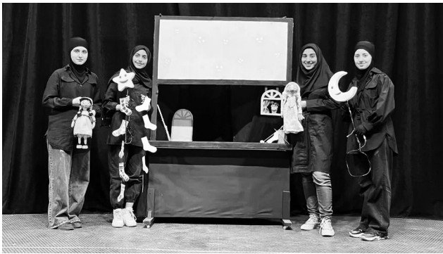
کارگردان: فاطمه فارسی