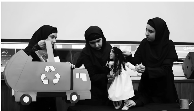
کارگردان: ساره وفا