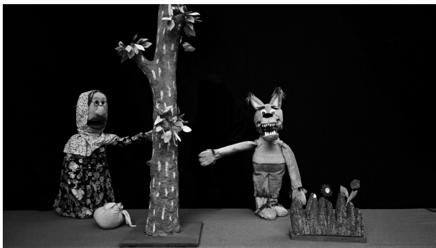
کارگردان: زهرا محیطی