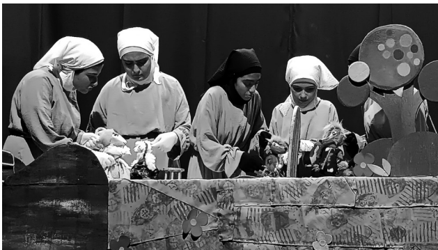
کارگردان: فائزه مرزبان